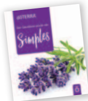
Ser Saudável Pode Ser Simples