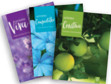
Guias Viva, Compartilhe e Construa