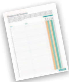
Registro do Sucesso