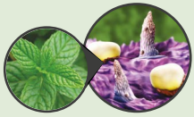
Bolsa de óleo da folha de Hortelã-pimenta